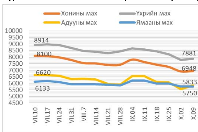
Зураг 1. Ястай махны жижиглэн худалдааны дундаж үнэ Зураг 2. Цул махны жижиглэн худалдааны дундаж үнэ

2013 оны 10-р сарын 9-ны байдлаар 1 кг хонины /ястай/ махны үнэ дунджаар 6948 төгрөг, хонины цул мах 7426 төгрөг, үхрийн /ястай/ мах 7881 төгрөг, үхрийн цул мах 9590 төгрөг, ямааны мах 5750 төгрөг, адууны мах 5833 төгрөгийн үнэтэй байв (Зураг 1; 2).