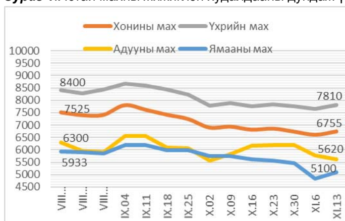
Зураг 1. Ястай махны жижиглэн худалдааны дундаж үнэ Зураг 2. Цул махны жижиглэн худалдааны дундаж үнэ

2013 оны 11-р сарын 13-ны байдлаар 1 кг хонины /ястай/ махны үнэ дунджаар 6755 төгрөг, хонины цул мах 7080 төгрөг, үхрийн /ястай/ мах 7810 төгрөг, үхрийн цул мах 9245 төгрөг, ямааны мах 5100 төгрөг, адууны мах 5620 төгрөгийн үнэтэй байв (Зураг 1; 2).