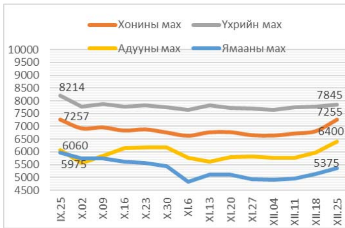
Зураг 1. Ястай махны жижиглэн худалдааны дундаж үнэ Зураг 2. Цул махны жижиглэн худалдааны дундаж үнэ

2013 оны 12-р сарын 25-ны байдлаар 1 кг хонины /ястай/ мах дунджаар 7255 төгрөг, хонины цул мах 6750 төгрөг, үхрийн /ястай/ мах 7845 төгрөг, үхрийн цул мах 9340 төгрөг, адууны мах 6400 төгрөг, ямааны мах 5375 төгрөгийн үнэтэй байв (Зураг 1; 2).