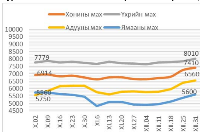
Зураг 1. Ястай махны жижиглэн худалдааны дундаж үнэ Зураг 2. Цул махны жижиглэн худалдааны дундаж үнэ

2013 оны 12-р сарын 31-ний байдлаар 1 кг хонины /ястай/ мах дунджаар 7410 төгрөг, хонины цул мах 7100 төгрөг, үхрийн /ястай/ мах 8010 төгрөг, үхрийн цул мах 9590 төгрөг, адууны мах 6560 төгрөг, ямааны мах 5600 төгрөгийн үнэтэй байв (Зураг 1; 2).