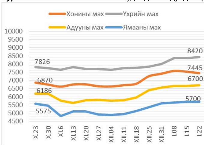
Зураг 1. Ястай махны жижиглэн худалдааны дундаж үнэ Зураг 2. Цул махны жижиглэн худалдааны дундаж үнэ

2014 оны 1-р сарын 22-ны байдлаар 1 кг хонины /ястай/ мах дунджаар 7445 төгрөг, хонины цул мах 7525 төгрөг, үхрийн /ястай/ мах 8420 төгрөг, үхрийн цул мах 9965 төгрөг, адууны мах 6700 төгрөг, ямааны мах 5700 төгрөгийн үнэтэй байв (Зураг 1; 2).