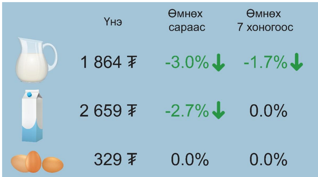
Зураг 3. Өндөг, сүүний дундаж үнэ, төгрөг

Сүү, өндөг, ургамлын болон цөцгийн тосны дундаж үнэ: 2019 оны 4-р сарын 17-ны байдлаар өмнөх сараас элекстер” /0.5 литрийн/ сүүний үнэ 0.7 хувь, задгай сүүний үнэ 3.0 хувь, савласан /1 литрийн/ сүүний үнэ 2.7 хувиар буурсан байна. Өмнөх 7 хоногоос задгай сүүний үнэ 1.7 хувиар буурч, савласан /1 литрийн/ сүүний үнэ болон элекстер” /0.5 литрийн/ сүүний үнэ өөрчлөлтгүй байна.