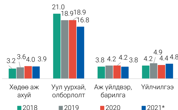
ЗУРАГ 2. НЭГ АЖИЛЛАГЧИД НОГДОХ ДНБ, салбараар, жил бүрийн 3 дугаар улиралд, сая төгрөгөөр

Үйлчилгээний салбарын нэг ажиллагчид ногдох нэмэгдэл өртөг 4.8 сая төгрөгт хүрч, өмнөх оны мөн үеэс 414.3 (9.5%) мянган төгрөгөөр нэмэгдсэн бол хөдөө аж ахуйн салбарынх 3.9 сая төгрөг болж, 105.4 (2.6%) мянган төгрөгөөр, уул уурхай, олборлолтын салбарынх 16.8 сая төгрөг болж, 2.1 (11.3%) сая төгрөгөөр, аж үйлдвэр, барилгын салбарынх 3.8 сая төгрөг болж, өмнөх оны мөн үеэс 380.1 (9.1%) мянган төгрөгөөр тус тус буурчээ.