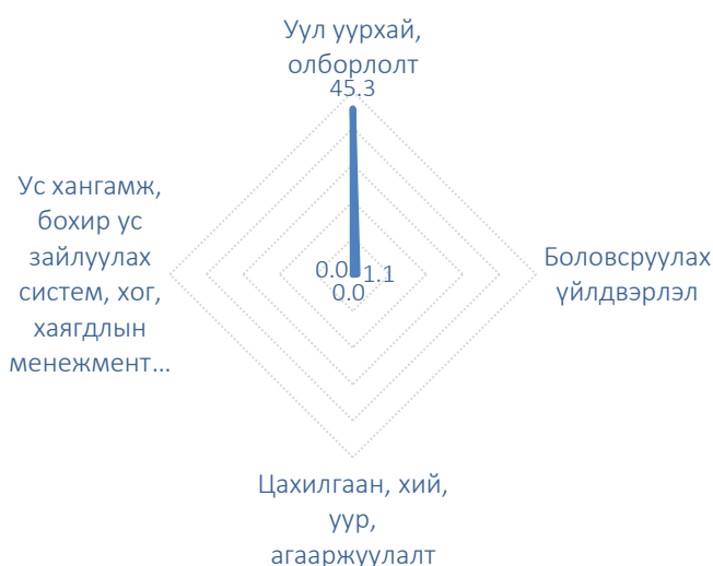
Зураг 2. Аж үйлдвэрийн салбарын үйлдвэрлэгчийн үнийн индексийн өөрчлөлтөд дэд салбаруудын оролцооны түвшин, нэгжээр, өмнөх оны мөн үетэй харьцуулснаар

Аж үйлдвэрийн салбарын үйлдвэрлэгчийн үнэ өмнөх оны мөн үеэс 46.5 хувиар өсөхөд уул уурхай, олборлолтын салбарын үйлдвэрлэгчийн үнэ 45.3 нэгж, боловсруулах үйлдвэрийн салбарын үйлдвэрлэгчийн үнэ 1.1 нэгжээр нөлөөлсөн байна.