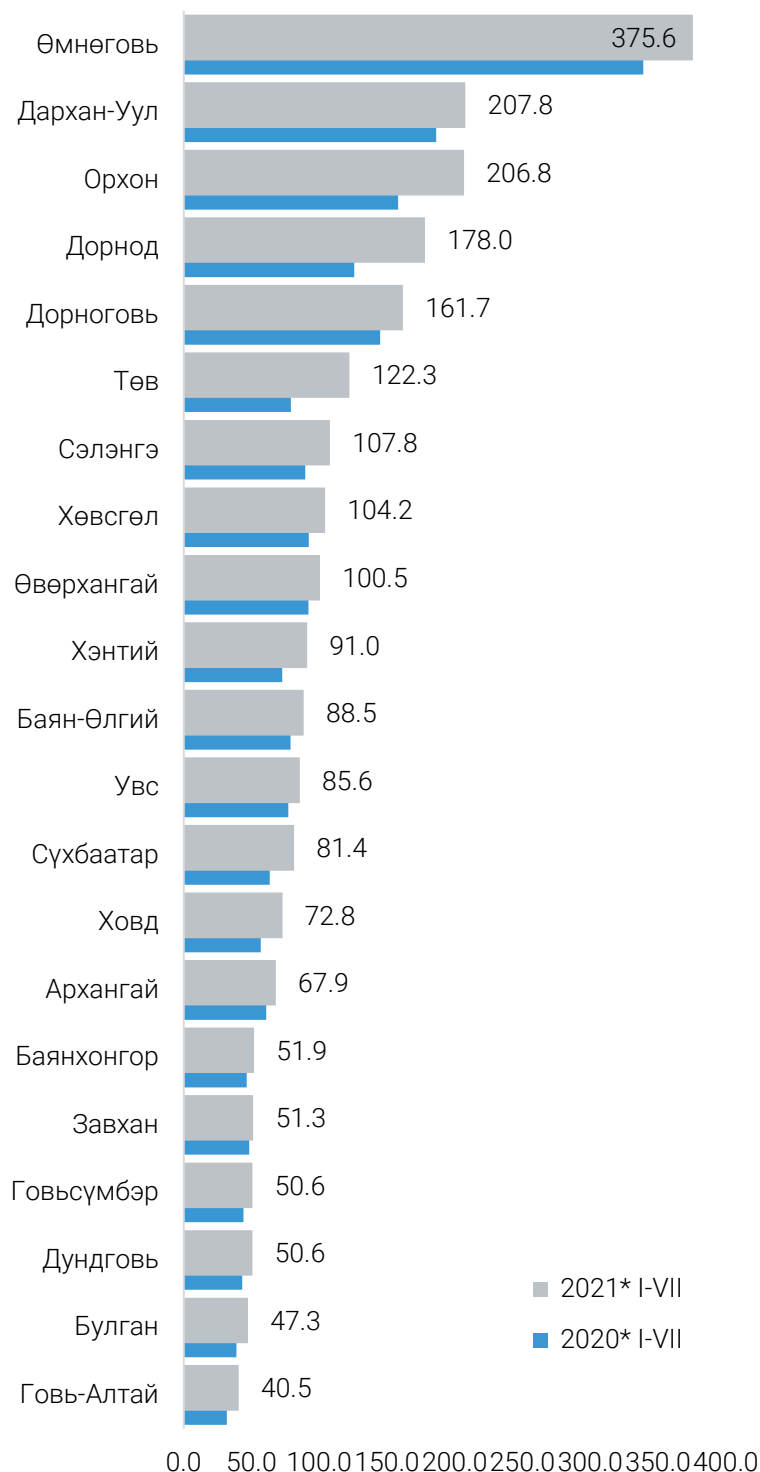
ЗУРАГ 2. ХУДАЛДААНЫ САЛБАРЫН БОРЛУУЛАЛТ, аймгаар, жил бүрийн эхний 7 сард, тэрбум төгрөгөөр

Өмнөговь аймгийн худалдааны борлуулалт 2021 оны эхний 7 сард 375.6 тэрбум төгрөг болж, аймгуудын (Улаанбаатар хотыг оруулаагүй) борлуулалтын нийт дүнд 16.0 хувийг эзэлж байна.