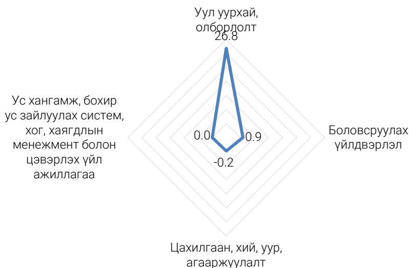
Зураг 2. Аж үйлдвэрийн салбарын үйлдвэрлэгчийн үнийн индексийн өөрчлөлтөд дэд салбаруудын оролцооны түвшин, нэгжээр, өмнөх оны мөн үетэй харьцуулснаар

Аж үйлдвэрийн салбарын үйлдвэрлэгчийн үнэ өмнөх оны мөн үеэс 27.5 хувиар өсөхөд уул уурхай, олборлолтын салбарын үйлдвэрлэгчийн үнэ 26.8 нэгж, боловсруулах үйлдвэрийн салбарын үйлдвэрлэгчийн үнэ 0.9 нэгжээр нөлөөлсөн байна.