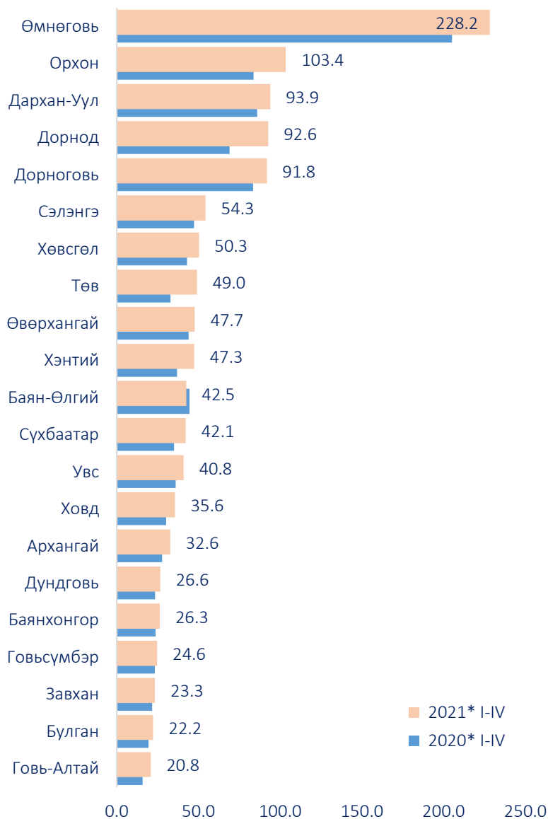
Зураг 3. Худалдааны салбарын борлуулалт, аймгаар, жил бүрийн эхний 4 сард, тэрбум төгрөгөөр

Өмнөговь аймгийн худалдааны борлуулалт 2021 оны эхний 4 сард 228.2 тэрбум төгрөг болж, аймгуудын (Улаанбаатар хотыг оруулаагүй) борлуулалтын нийт дүнд 19.1 хувийг эзэлж байна.