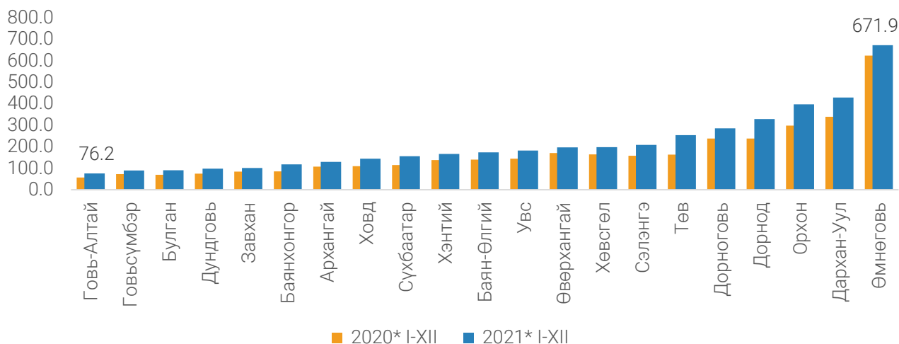
ЗУРАГ 2. ХУДАЛДААНЫ САЛБАРЫН БОРЛУУЛАЛТЫН ОРЛОГО, аймгаар, жил бүрийн эцсийн байдлаар, тэрбум төгрөг

Худалдааны салбарын борлуулалтын орлогын 83.8 хувь нь Улаанбаатар хотод ногдож байна. Улаанбаатар хотын худалдааны салбарын борлуулалтын орлого 2021 онд 23.3 их наяд төгрөг болж, өмнөх оноос 4.8 (26.2%) их наяд төгрөгөөр өслөө. Худалдааны салбарын борлуулалтын орлого аймгуудад 7.7-55.2 хувиар өссөн байна.