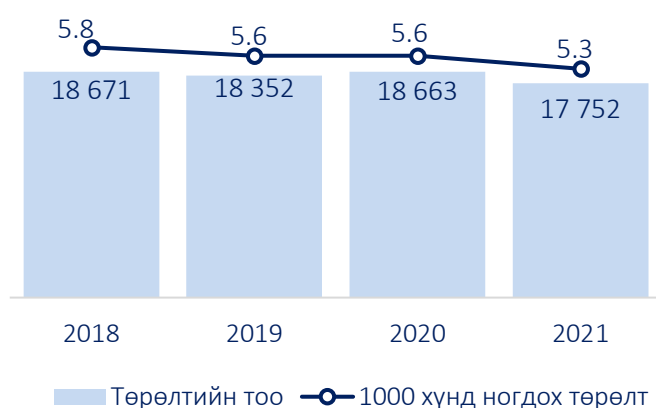
Зураг 1. Төрөлт, жил бүрийн эхний улирлын байдлаар

1000 хүнд ногдох төрөлт өмнөх оны мөн үеэс 0.3 пунктээр буурсан байна.