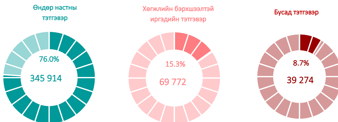
Зураг 2. Нийгмийн даатгалын сангаас тэтгэвэр авагчид, төрлөөр, 2021 оны эхний 5 сард

Нийгмийн халамжийн сангаас 2021 оны эхний 5 сард 2.3 (давхардсан тоогоор) сая хүнд 828.0 тэрбум төгрөгийн тэтгэвэр, тэтгэмж, тусламж, үйлчилгээ, хөнгөлөлт олгосон нь өмнөх оны мөн үеэс нийгмийн халамжийн үйлчилгээнд хамрагдагчид 90.2(4.2%) мянгаар, үйлчилгээнд олгосон тэтгэвэр, тэтгэмж, тусламж, үйлчилгээ, хөнгөлөлтийн хэмжээ 352.7 (74.2%) тэрбум төгрөгөөр нэмэгджээ.