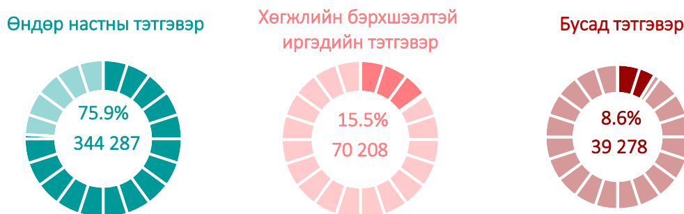
Зураг 2. Нийгмийн даатгалын сангаас тэтгэвэр авагчид, төрлөөр, 2021 оны эхний улиралд

Хөдөлмөр, халамжийн үйлчилгээний ерөнхий газрын мэдээллээр нийгмийн халамжийн сангийн санхүүжилт 2021 оны эхний улиралд 538.5 тэрбум төгрөг болж өмнөх оны мөн үеэс 308.1 (2.3 дахин) тэрбум төгрөгөөр, зарцуулалт 310.2 (2.5 дахин) тэрбум төгрөгөөр өсжээ.