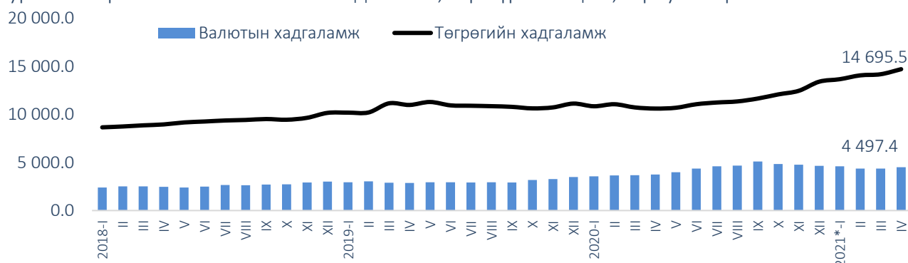
Зураг 1. Төгрөгийн болон валютын хадгаламж, сар бүрийн эцэст, тэрбум төгрөг