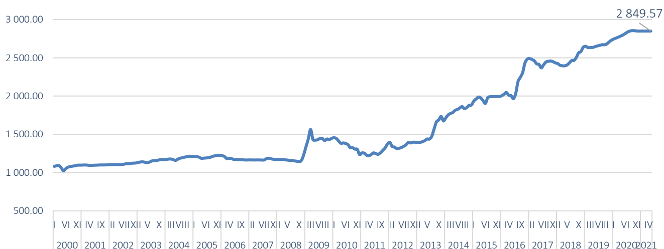
Зураг 3. Төгрөгийн ам.доллартай харьцах ханш, сараар