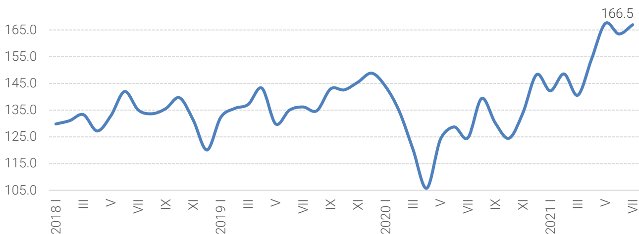
Зураг 1. Аж үйлдвэрийн салбарын үйлдвэрлэгчийн үнийн индекс (2015=100), сараар, хувь

Аж үйлдвэрийн салбарын үйлдвэрлэгчийн үнэ 2021 оны 7 дугаар сард өмнөх оны мөн үеэс 33.6 хувиар өсөхөд уул уурхай, олборлолтын дэд салбарын үйлдвэрлэгчийн үнэ 41.7 хувиар (чулуун, хүрэн нүүрс олборлолтын үнэ 8.2 хувь, газрын тос, байгалийн хий олборлолтын үнэ 85.8 хувь, металлын хүдэр олборлолтын үнэ 34.9 хувь, бусад ашигт малтмал олборлолтын үнэ 14.3 хувь) өссөнөөс шалтгаалсан байна.