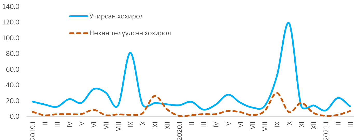
Зураг 2. Учирсан хохирол, нөхөн төлүүлсэн хохирол, сараар, тэрбум төгрөгөөр

Гэмт хэргийн улмаас учирсан хохирол 2021 оны эхний улиралд 42.6 тэрбум төгрөг, нөхөн төлүүлсэн хохирлын хэмжээ 9.8 тэрбум төгрөг болж, өмнөх оны мөн үеэс учирсан хохирол 5.3 (14.1%) тэрбум төгрөгөөр, нөхөн төлүүлсэн хохирол 3.9 (64.7%) тэрбум төгрөгөөр тус тус өссөн байна.