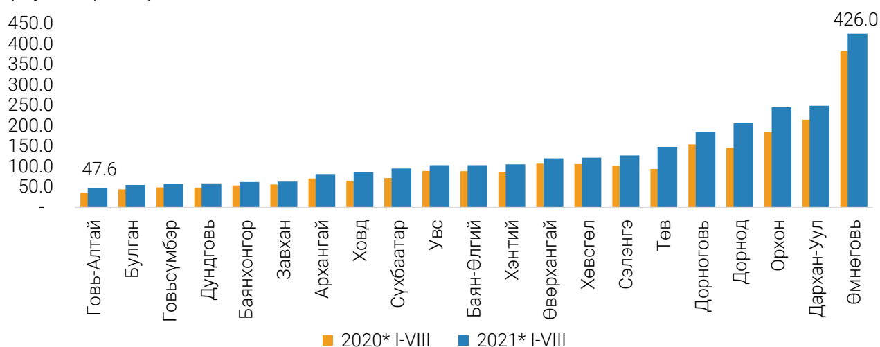
ЗУРАГ 2. ХУДАЛДААНЫ САЛБАРЫН БОРЛУУЛАЛТ, аймгаар, жил бүрийн эхний 8 сард, тэрбум төгрөгөөр

Өмнөговь, Дархан-Уул, Орхон, Дорнод, Дорноговь, Төв аймгийн худалдааны борлуулалт нь аймгуудын (Улаанбаатар хотыг оруулаагүй) худалдааны борлуулалтын нийт дүнд 50 гаруй хувийг эзэлж байна.