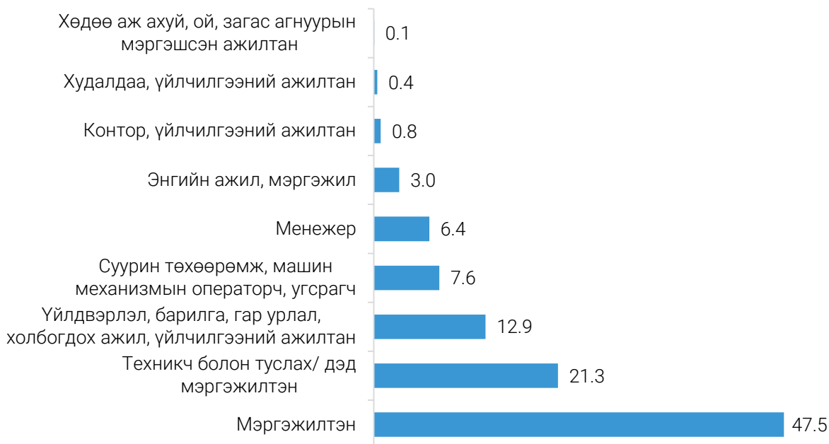
ЗУРАГ 2. ХӨДӨЛМӨРИЙН ГЭРЭЭГЭЭР АЖИЛ ЭРХЭЛЖ БУЙ ГАДААДЫН ИРГЭД, ажил мэргэжлийн ангилал, дүнд эзлэх хувиар, 2021 оны 3 дугаар улирлын байдлаар

Манай улсад 2021 оны 3 дугаар улиралд ажил эрхэлж буй гадаадын иргэдийн 1.7 (29.6%) мянга нь барилгын, 1.6 (28.0%) мянга нь уул уурхай, олборлолтын, 597 (10.4%) нь боловсролын, 526 (9.1%) нь боловсруулах үйлдвэрлэлийн, 443 (7.7%) нь тээвэр ба агуулахын үйл ажиллагааны, 351 (6.1%) нь бөөний болон жижиглэн худалдаа, машин, мотоциклийн засвар үйлчилгээний, 91 (1.6%) нь удирдлагын болон дэмжлэг үзүүлэх үйл ажиллагааны, 434 (7.5%) нь бусад салбарт ажиллаж байна. Өмнөх улиралтай харьцуулахад, тухайлбал барилгын салбарт ажил эрхэлж буй гадаадын иргэд 721 (73.5%) хүнээр, тээвэр ба агуулахын салбарт 237 (2.2 дахин) хүнээр өссөн байна.