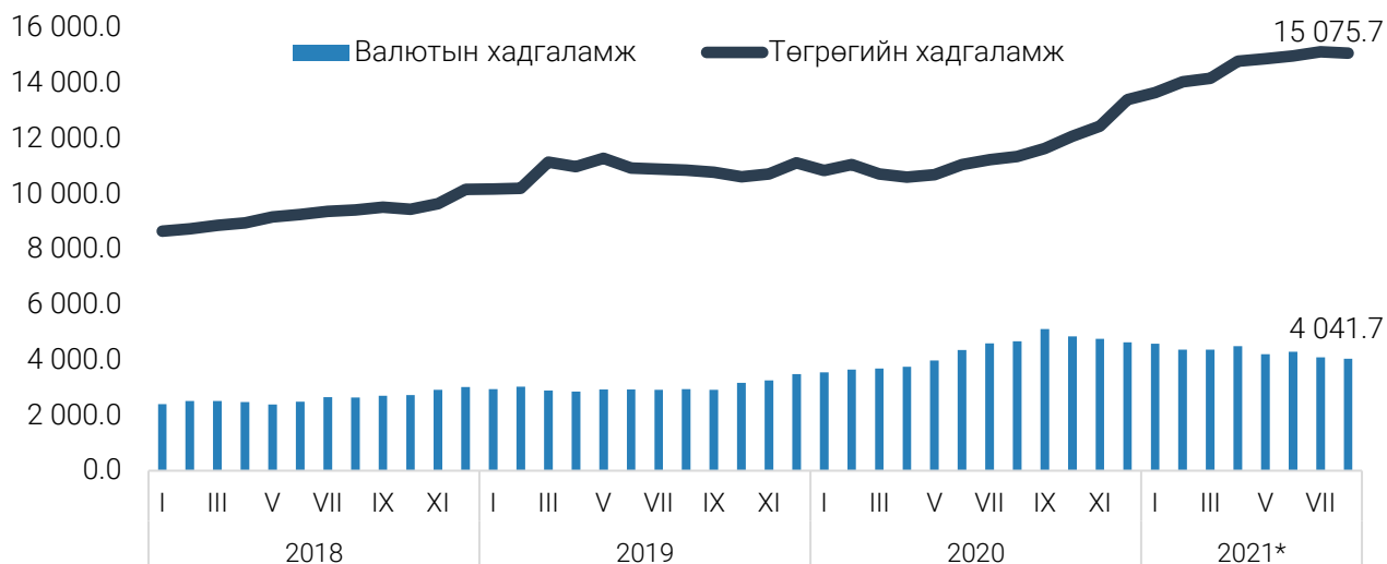
ЗУРАГ 1. ТӨГРӨГИЙН БОЛОН ВАЛЮТЫН ХАДГАЛАМЖ, сар бүрийн эцэст, тэрбум төгрөг

Төгрөгийн хадгаламж 2021 оны 8 дугаар сарын эцэст 15.1 их наяд төгрөг болж, өмнөх сараас 130.4 (0.9%) тэрбум төгрөгөөр буурч, өмнөх оны мөн үеэс 3.7 (32.9%) их наяд төгрөгөөр өсжээ. Төгрөгийн хадгаламжийн 88.4 хувь (13.3 их наяд төгрөг) нь иргэдийн хадгаламж, 11.6 хувь (1.8 их наяд төгрөг) нь аж ахуйн нэгж, байгууллагын хадгаламж байна.