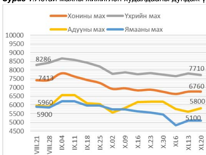
Зураг 1. Ястай махны жижиглэн худалдааны дундаж үнэ Зураг 2. Цул махны жижиглэн худалдааны дундаж үнэ

2013 оны 11-р сарын 20-ны байдлаар 1 кг хонины /ястай/ махны үнэ дунджаар 6760 төгрөг, хонины цул мах 6950 төгрөг, үхрийн /ястай/ мах 7710 төгрөг, үхрийн цул мах 6950 төгрөг, ямааны мах 5100 төгрөг, адууны мах 5800 төгрөгийн үнэтэй байв (Зураг 1; 2).