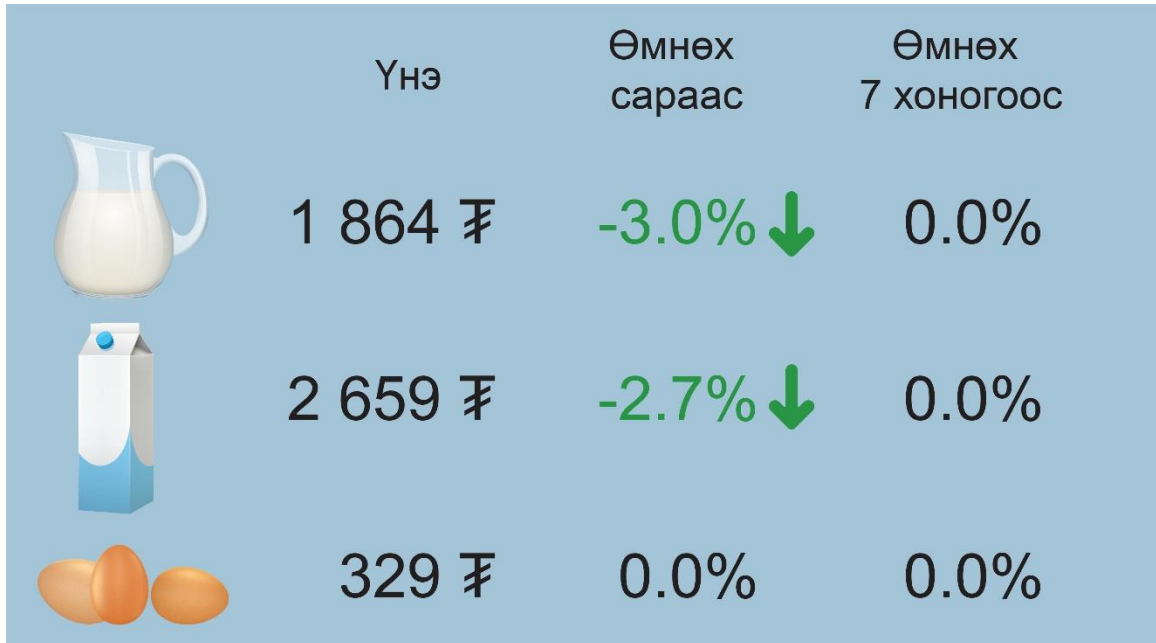
Зураг 3. Өндөг, сүүний дундаж үнэ, төгрөг

Сүү, өндөг, ургамлын болон цөцгийн тосны дундаж үнэ: 2019 оны 4-р сарын 24-ний байдлаар өмнөх сараас элекстер” /0.5 литрийн/ сүүний үнэ 0.7 хувь, задгай сүүний үнэ 3.0 хувь, савласан /1 литрийн/ сүүний үнэ 2.7 хувиар буурсан байна. Өмнөх 7 хоногоос сүүний үнэ өөрчлөлтгүй байна.